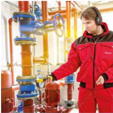
Признаки износа насосов и других обрабатывающих машин можно обнаружить на ранней стадии с помощью зонда обнаружения структурных звуков.