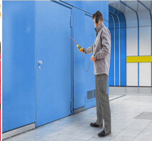
В комбинации с ультразвуковым передатчиком SL800T, испытания на герметичность например, противопожарных дверей, можно выполнять быстро и с низкими затратами.